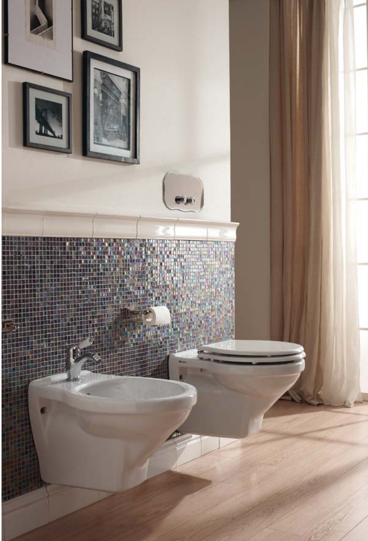
art. 5398_5324 + S324