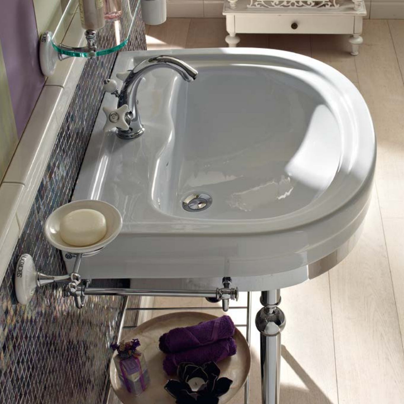
art. 5369 + M369G-1PCR