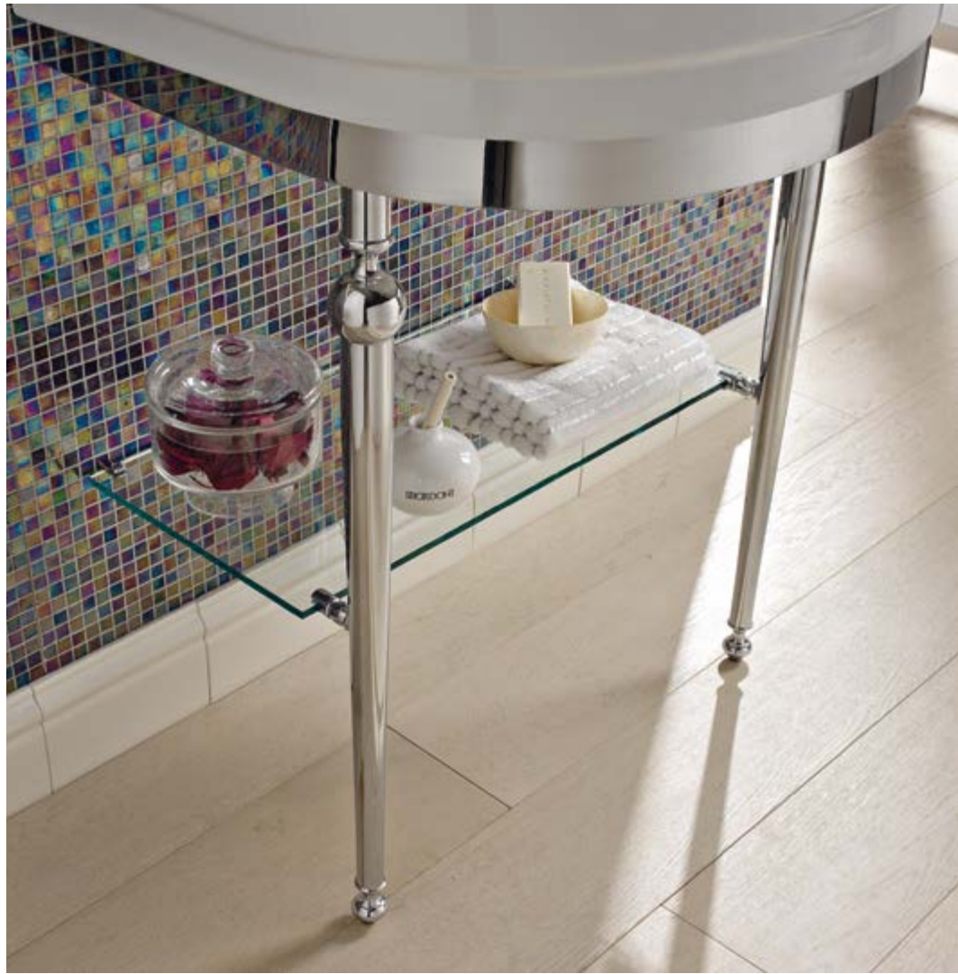
art. 5369 + M369