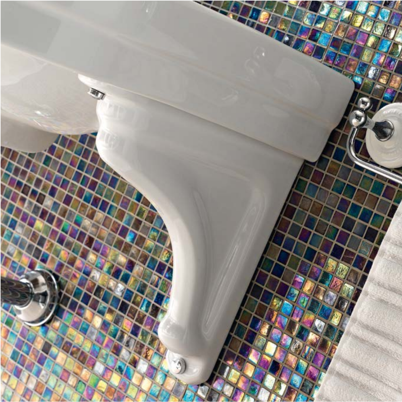
art. 5369 + 5369M