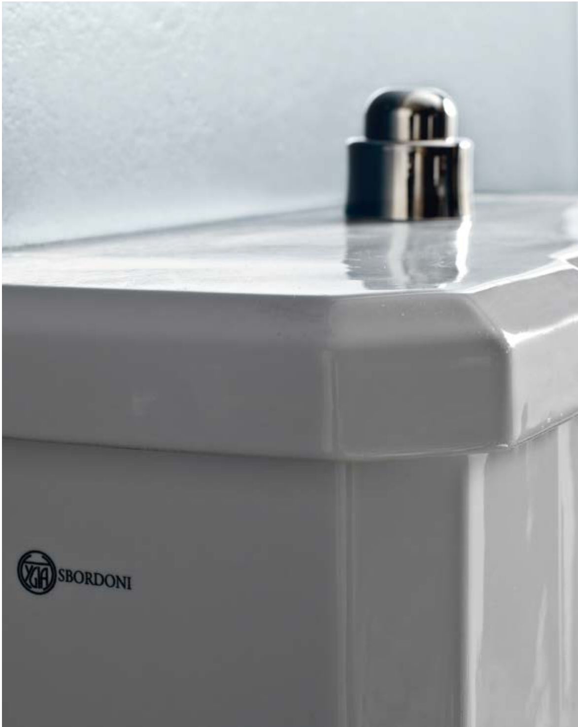
art. 5177 + 5130 + MC11