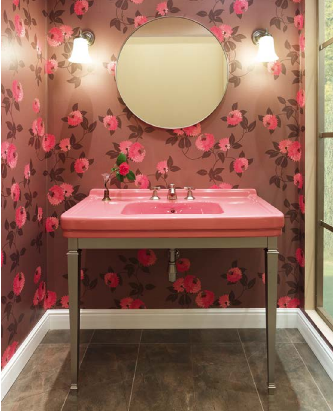
art. 5700/Pink + N703-NIO