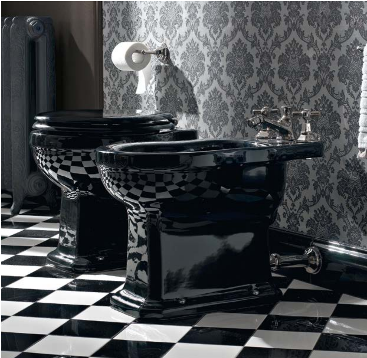
art. 5903N _ 5107N + S104

Modernità e tradizione si fondono quando Neoclassica si tinge di nero. Un connubio accattivante che regala emozioni inaspettate.