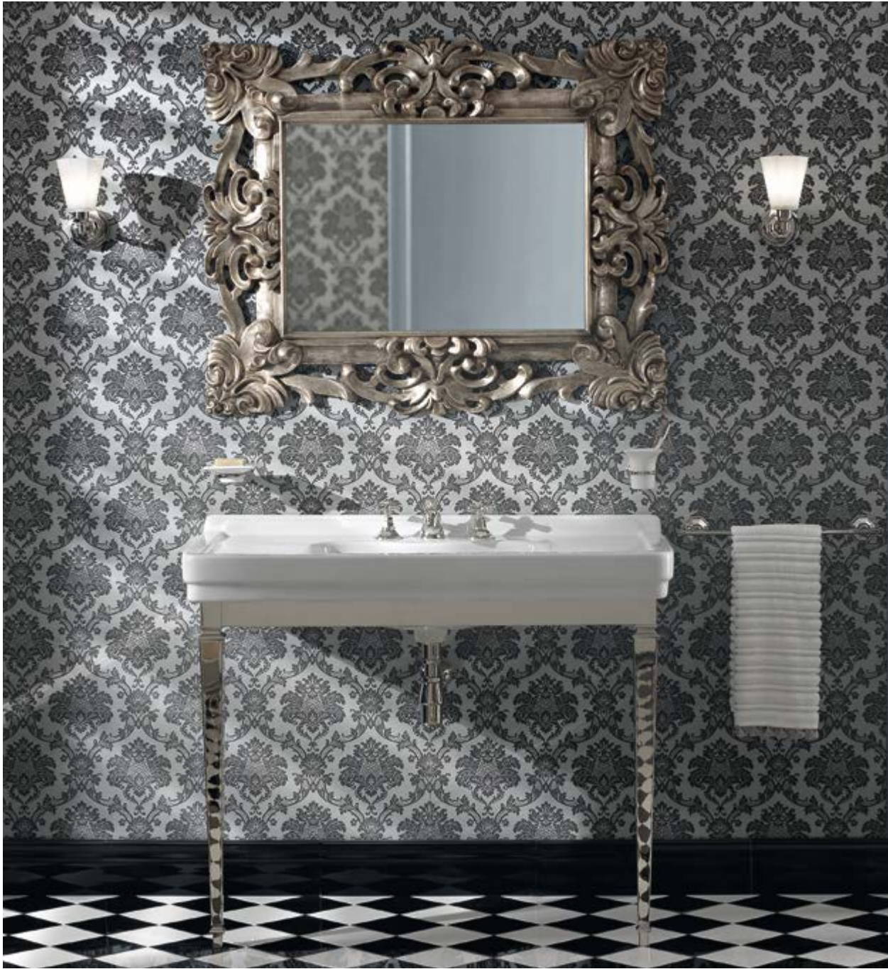
art. 5700 + N703

La semplicità diventa bellezza nell'unione fra il delicato rigore della ceramica e la solida luminosità del metallo.