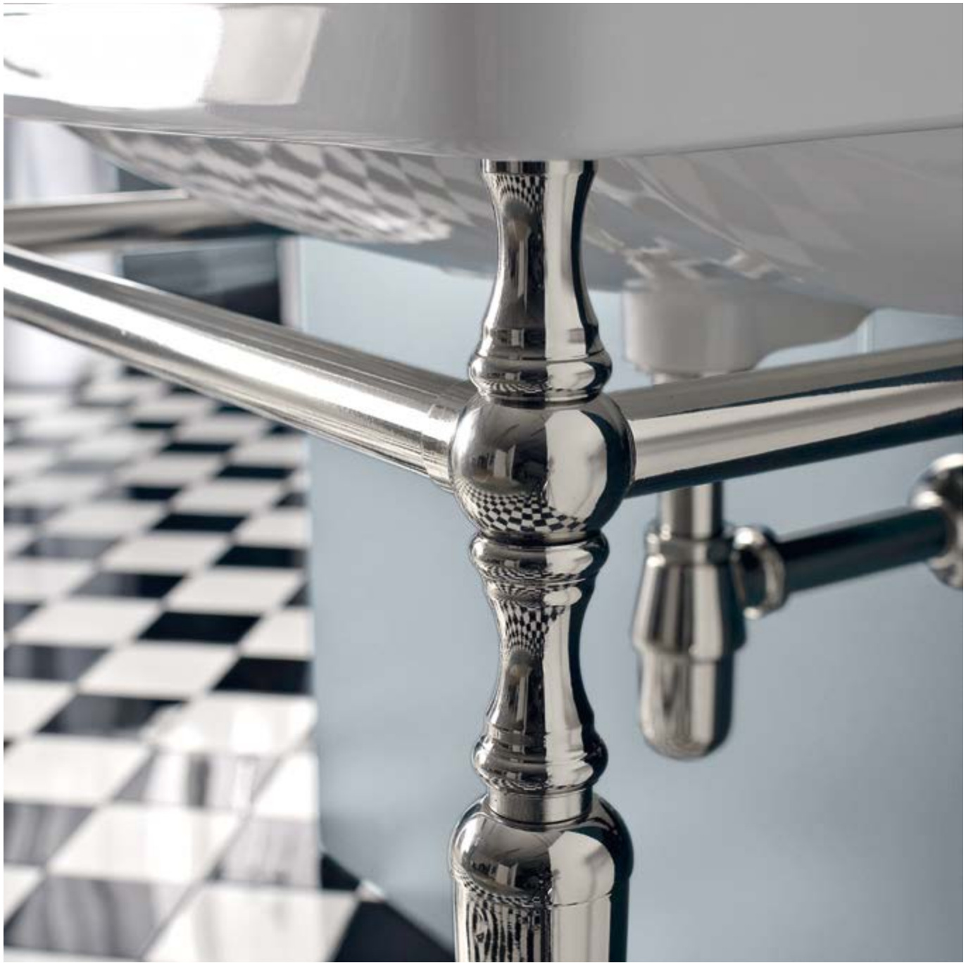
art. 5770 + P773