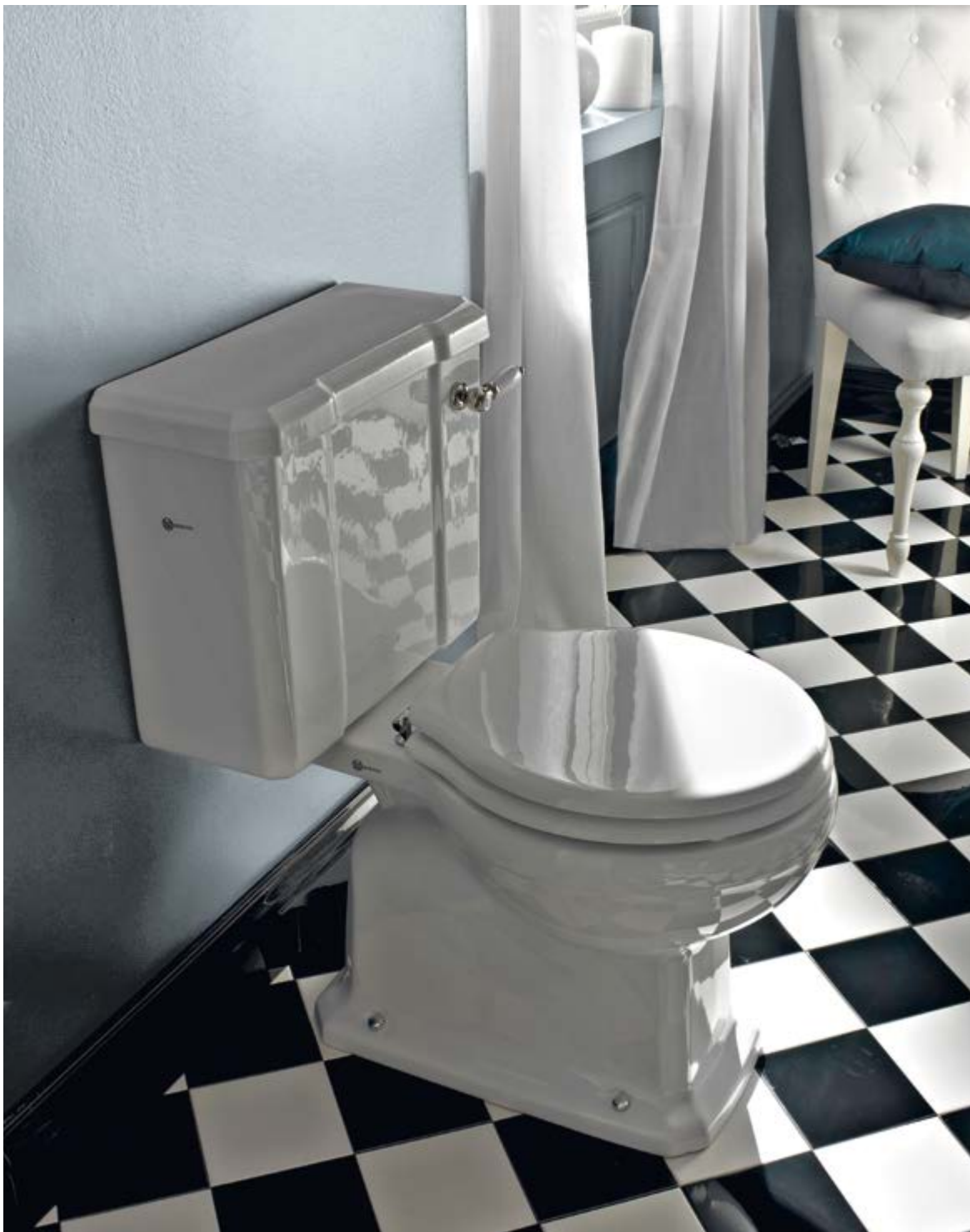
art. 5177 + S107 + 5130L + MC11-L

Purezza e solidità di linee si combinano con praticità e funzionalità in tutte le varianti di sanitari Neoclassica.