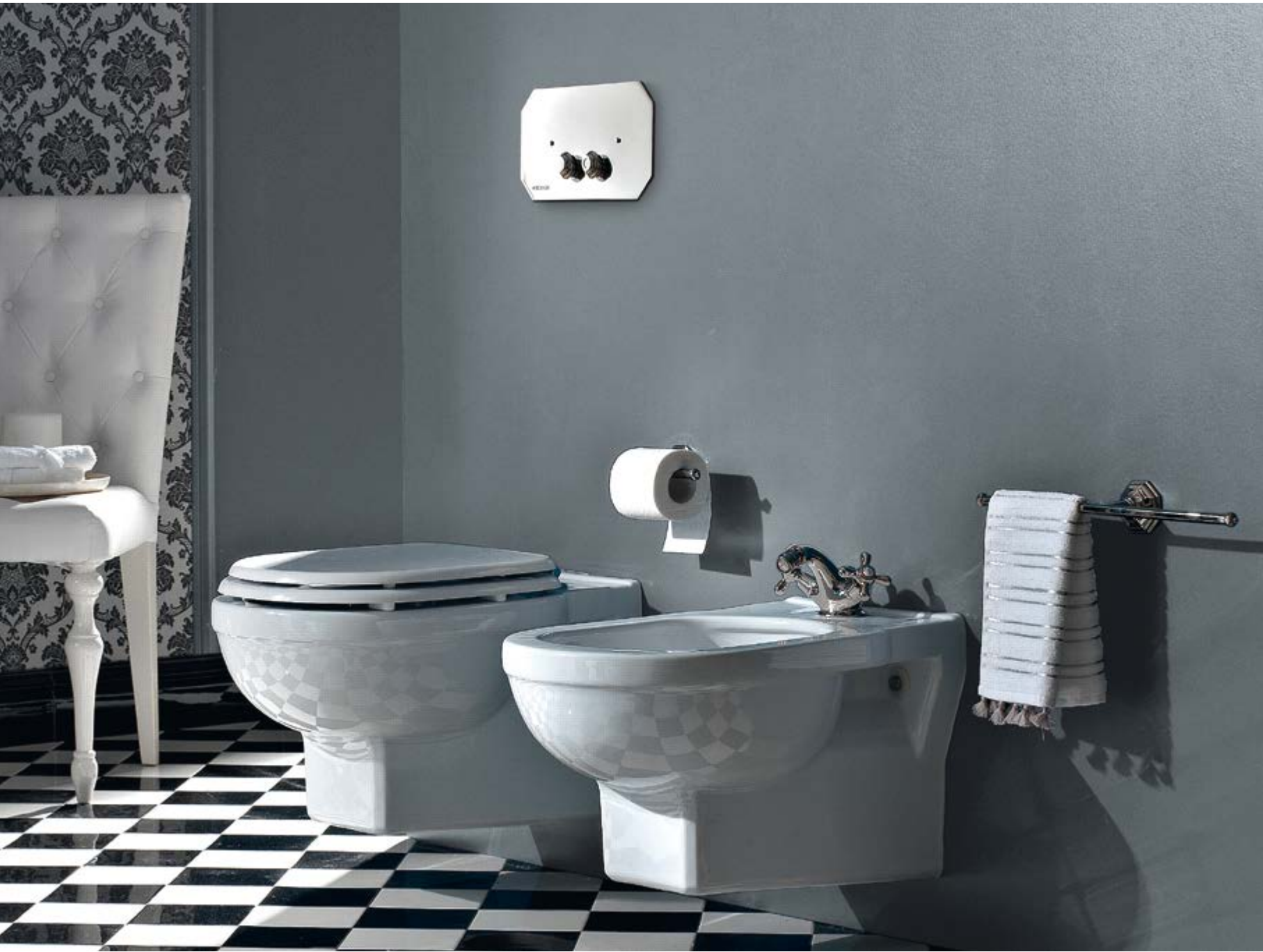
art. 5306 _ 5309 + S145