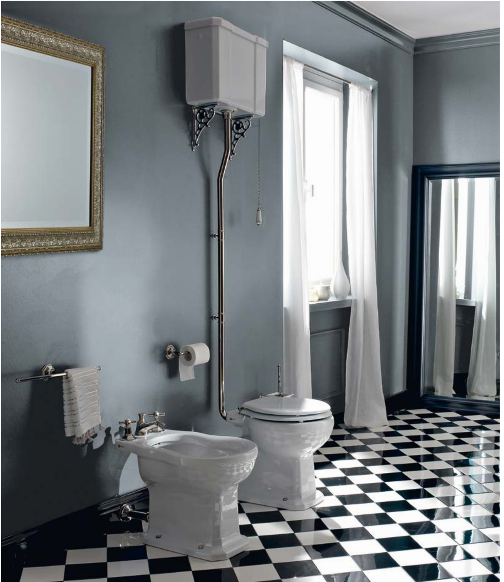
art. 5903 _ 5107 + S110 + 5128 + TB04 + MC04 + ST04