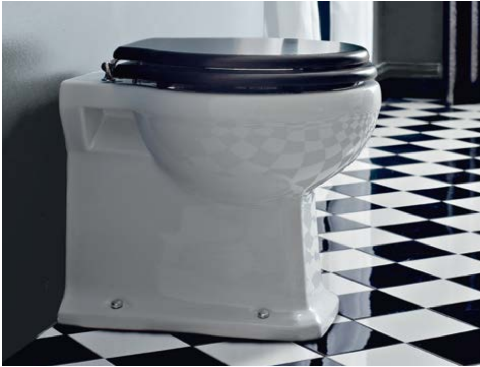
art. 5022 + S125

Nei sanitari Neoclassica c'è una storia di passione e tradizione che merita di essere perpetuata.